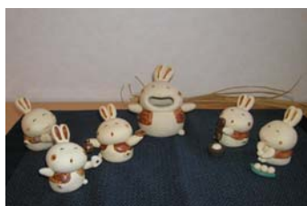
仲間が増えましたあ